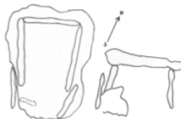
D. Vinya del Rei

Es troba situat a uns 3'5 Km del nucli de la població. Té una doble cavitat de forma trapezoïdal que mesura 2'20 m. d'amplada per 2'80 m. de llargada. Esta format per cinc grans lloses i posseeix una avant cambra. La llosa del fons té 2'20 m. d'amplada per 1'80 m. d'alçada. La paret dreta té 2 lloses : una de 2'30 m. de llargada i l'altra d' 1'20 m de llargada .A la paret esquerra, també té dues lloses de 2'60 m. i 1'60 m. de llargada .L'alçada de les lloses oscil·la entre 1'60 i 1'80 m. La coberta està formada per una llosa que mesura 4'05 m. de llargada per 2'60 m. d'amplada. es pot considerar un sepulcre ric en troballes arqueològiques , formades per restes de ceràmiques, micròlits geomètrics, destrals de pedra i ganivets de sílex.