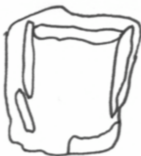
D. del Garrollà

Té una forma quasibé rectangular i es troba orientat al SW. La cambra mesura 1'90 m. d'ample per 2'65 m. de llarg. La paret del fons mesura 1'90 m. d'amplada per 1'65 m. d'alçada. La paret dreta està formada per dues lloses: de 1'80 m. per 1'65 i 0'90 per 1'20 m de llargada i alçada respectivament. La coberta està formada per una llosa de 3'48 m de llarg per 3m. d'ample.