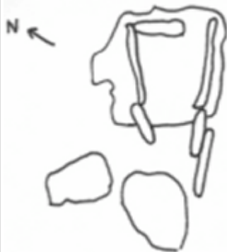
D. de La Talaia

Es troba situat en un petit turó denominat " de la Talaia", que domina tota la plana de l'Empordà. La seva tipologia correspon a la galeria catalana. Les seves parets formen una cambra trapezoïdal que mesura 1'50 m. d'ample, 3'50 m. i 1'10 m. d'alçada. Es troba orientat cap a l'Oest. El fons està format per una llosa d' 1'60 m. per 1'10 m. , amb una obertura semblant a la trobada a La Carena. A la dreta trobem tres lloses de 1'90 ,0'80 i 1'40 m. de llargada per 1'18 m. d'alçada. A l'esquerra hi havia 3 lloses de 1'60 ,0'95 i 1'10 m. per 1'18 m. d'alçada. La coberta estava formada per 2 lloses : 1 de 2'50 m. de llarg per 2'60 m. d'ample i l'altre caiguda davant del dolmen.