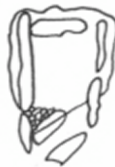
D. de La Carena

Dues lloses formaven la coberta: una està situada al seu lloc i mesura 2'70 m. de llarg per 2'20 d'ample i, una altra d' 1'70 m. per 0'90 m., que avui és a terra sostinguda en un dels costats.