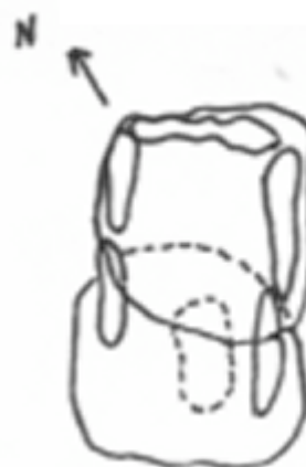
D. de Les Ruïnes

A uns 100 m. de l'anterior. Està orientat vers el SW , i la seva cambra té una forma rectangular de 2'70 m. de llarg per 1'35 m. d'ample, amb una alçada d' 1'65 m. Sis lloses sostenien la seva coberta, que consta de 2 grans lloses. Una de posterior de 2'35 m. per 2'10 m., i l'anterior de 2'25 m. per 2'30 m. les lloses verticals mesuren : 1'30 m. per 1'65 m. (fons), 1'70 m. per 1'40 m. i 1'20 per 1'65 m. (costat dret) i 1 m. per 1'65 , 0'95 m. per 1'35 m. d'alçada. Una tercera llosa , es troba caiguda a l'interior i mesura 1'50 m. de llarg per 0'50 m. d'ample (costat esquerra).