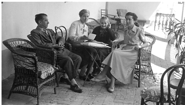
Amb l'àvia i els pares a la Galeria de casa Anglada. Juny de 1954

El violí d'Auschwitz (1994) i Quadern d'Aram (1997) s'obren a la llum del tercer dels horitzons de Maria Àngels Anglada, el de la dimensió crítica i el compromís solidari amb els febles, sense que la nova perspectiva suposi haver de bandejar els punts d'una sensibilitat que viatja prop del confort líric de la poesia i entaula diàlegs amorosos amb el món de la música. Daniel, el protagonista d' El violí d'Auschwitz , és un jueu de Cracòvia, violer d'ofici, tancat al camp d'extermini nazi on declara, per aproximació i per mirar de salvar la vida, que és fuster. Però quan els alemanys descobreixen que és luthier, es troba, per mor d'una juguesca a vida o mort, en el repte d'haver de construir un violí tan bo com un Stradivarius. La construcció del violí, que a la llarga servirà per convertir-lo en supervivent,