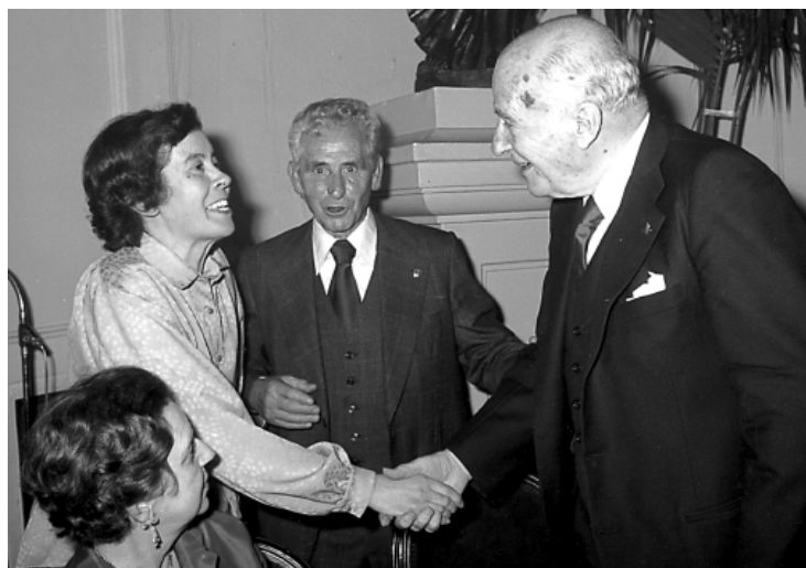
A Sant Quirze de Colera, 1982

Amb Josep Tarradellas el dia del lliurament del premi Josep Pla per l'obra Les Closes . 6 de gener de 1979