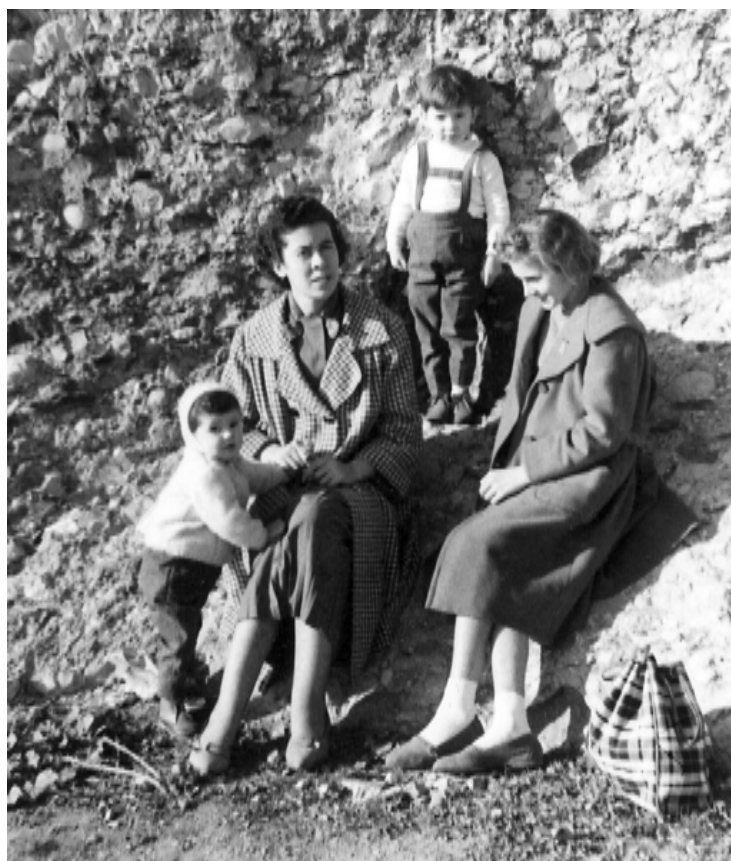
Amb les seves filles. Novembre de 1959