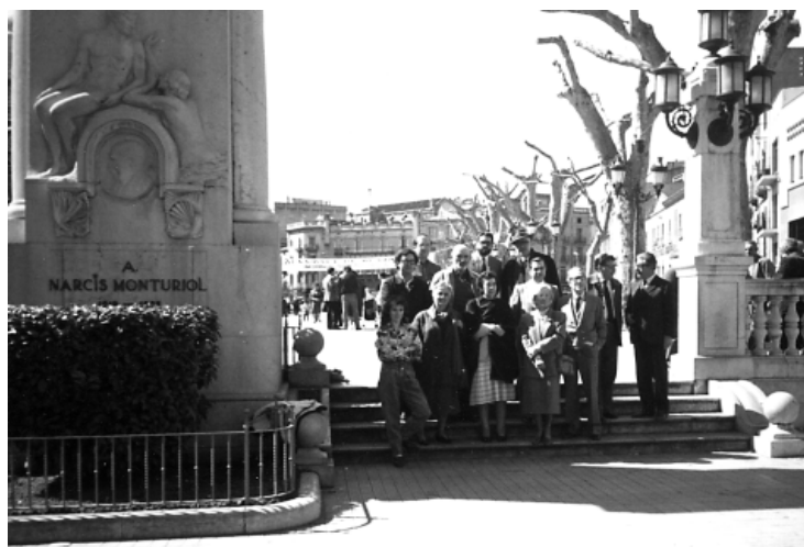
Escriptors empordanesos. Figueres, 1986