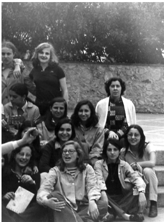
Amb les seves alumnes de les Escolàpies