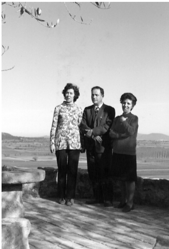
Velsatret. Abril de 1972