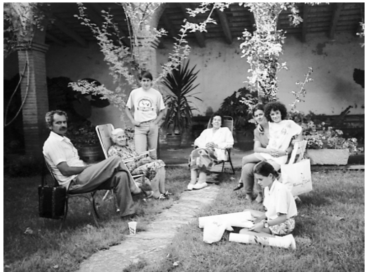
«Les Closes» Vilamacolum. Amb les dues nêtes grans. Estiu de 1992

Columnes d'hores Columna Edicions. Barcelona, 1990