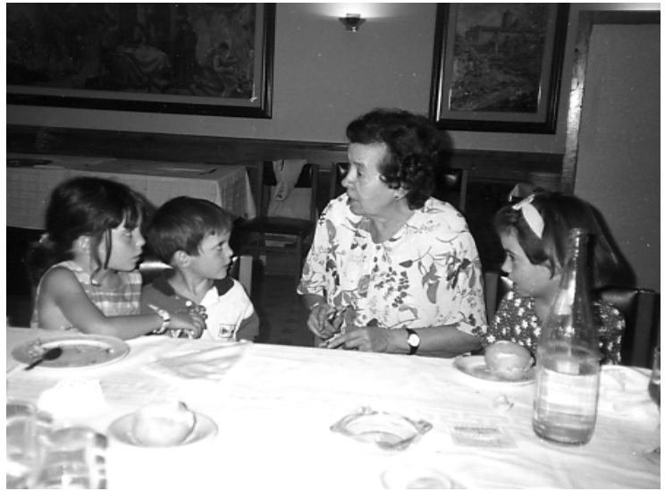
Explicant contes a la néta i els nebots. Vic, 1996