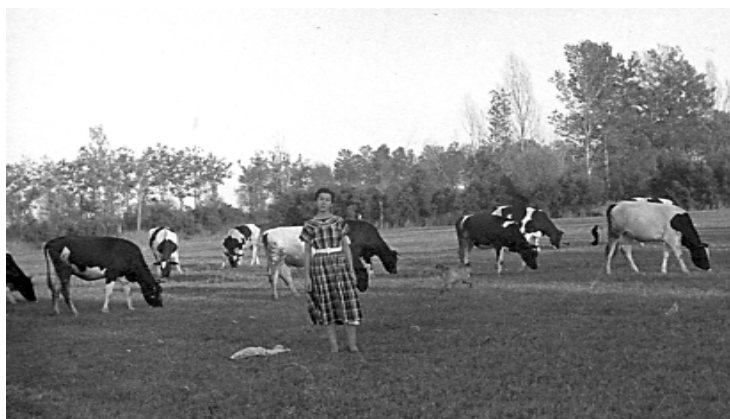
«Les Closes» de Vilamacolum. Estiu de 1954