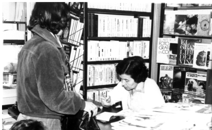
Signant el llibre Les Closes a la llibreria Laie, 1979